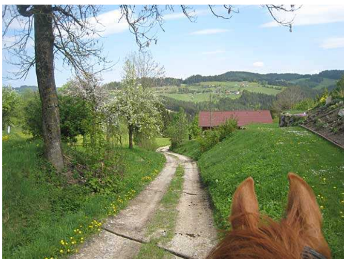
Feldweg nach Maasch