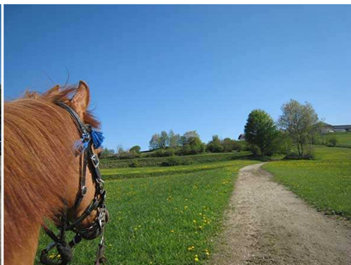
auf dem Weg nach Landshut bei Unterweißenbach