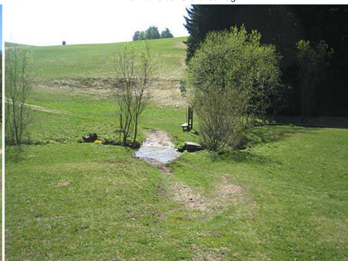
Furt über den Höllenbach