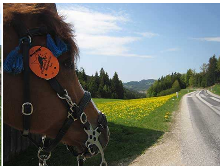
Ein kurzes Stück Strasse bei Aglasberg