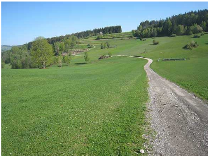
Ein langer Galoppweg (in umgekehrter Richtung)