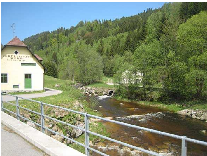
Brücke über die Waldaist mit "Wasserkraftwerk"