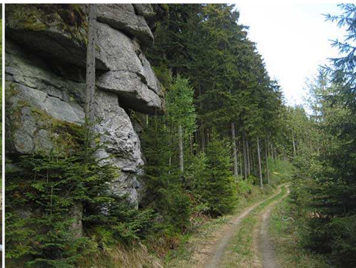
Felsformationen entlang der Waldaist