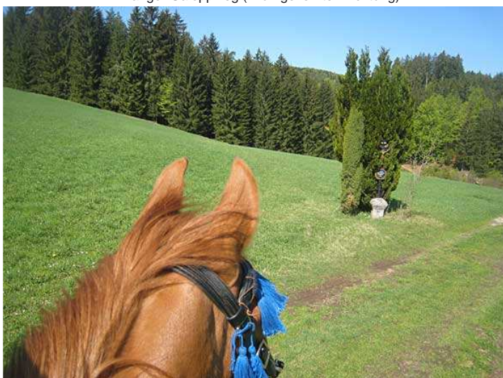
Auf dem Weg zum Höllenbach - ob sich dahinter wohl Wegelagerer verstecken?