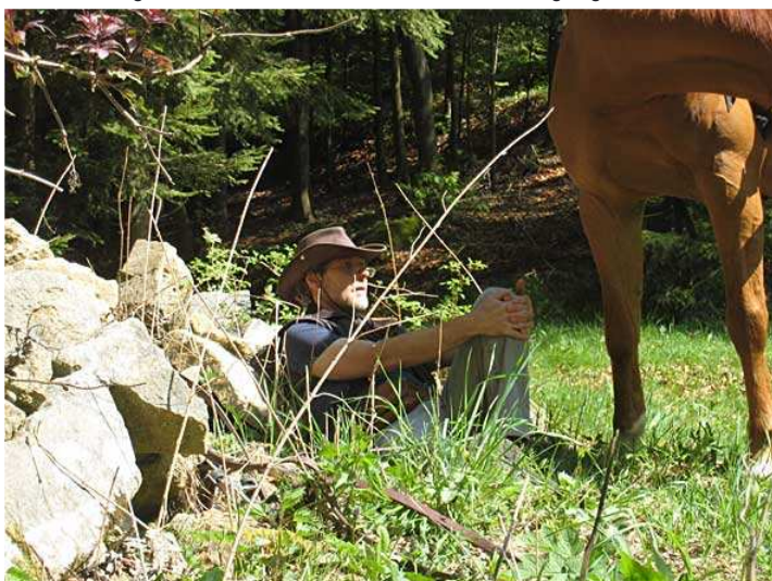
Ganz schön anstrengend so schnell vom Selbstausröser zum Felsen zu hechten!