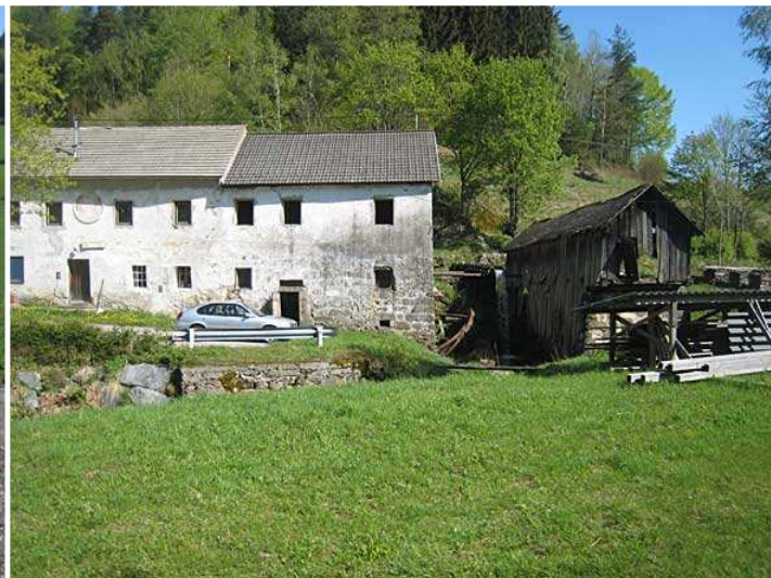
Alte Mühle bei Grafenschlag