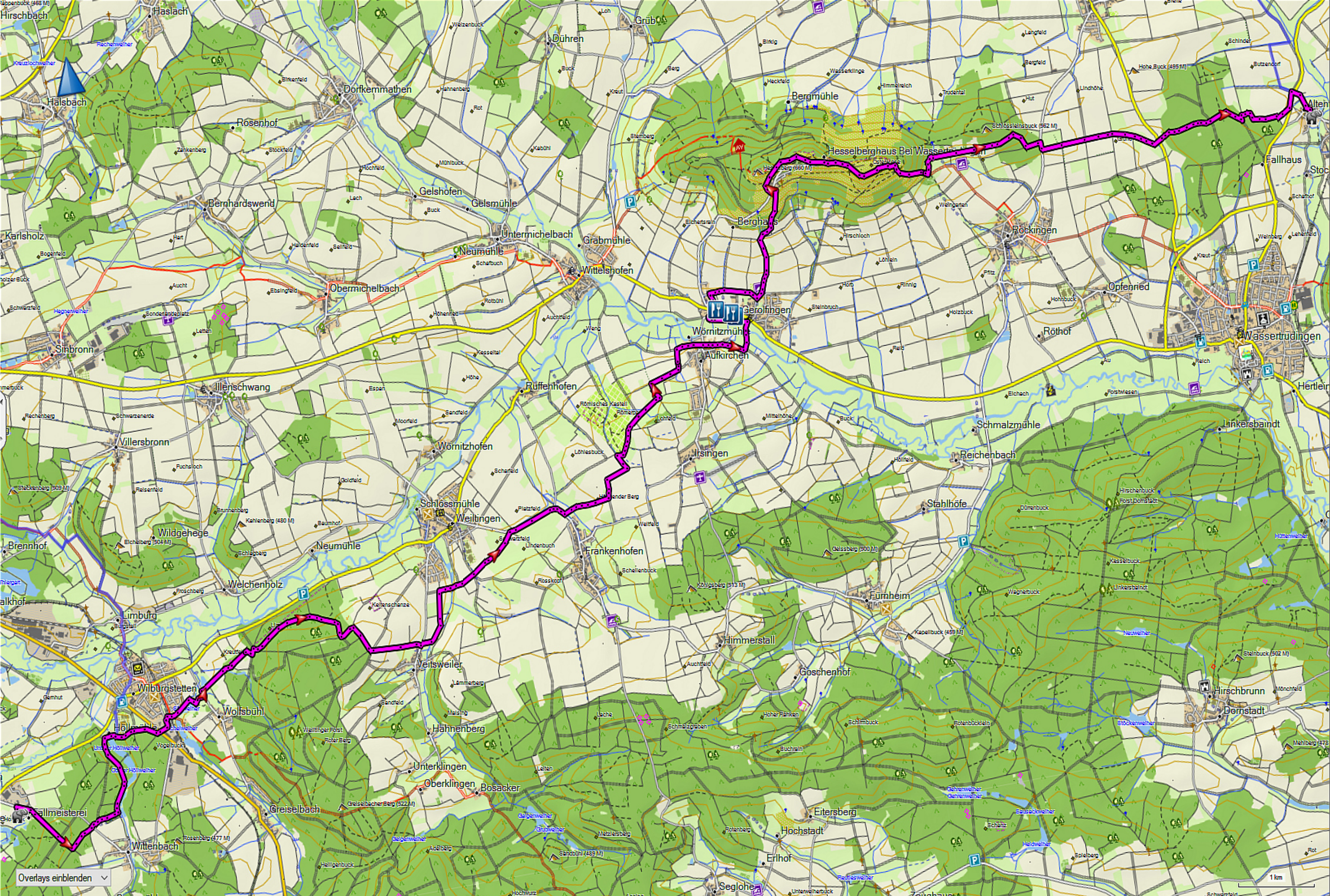
Tag 02 - 26,8km Mittag bei km16 v.l.