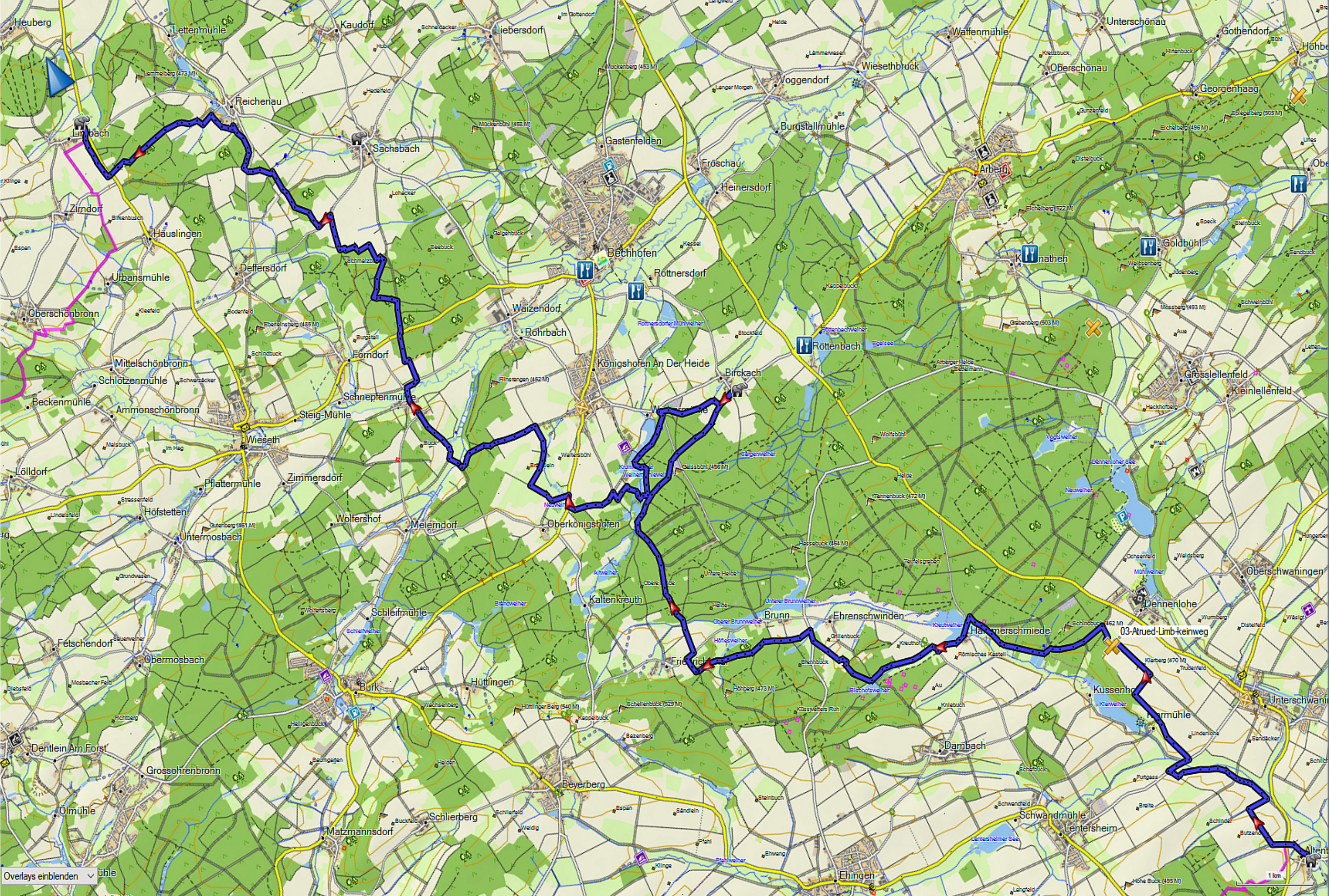
Tag 03 - 31,4km Mittag bei km16 v.l.