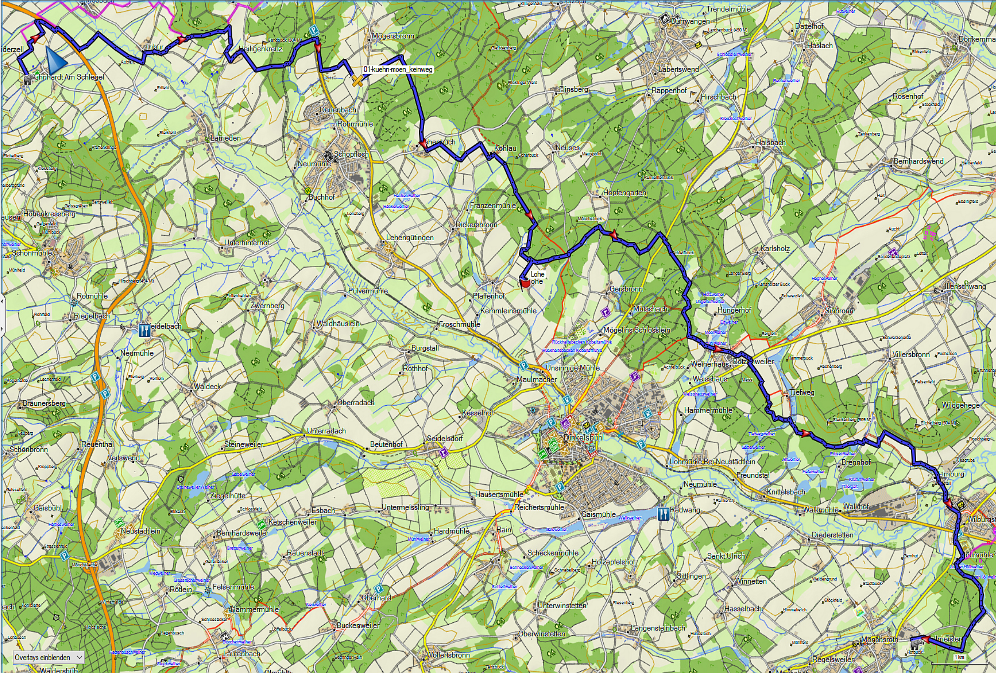
Tag 01 - 31,2km Mittag bei km16 v.l.