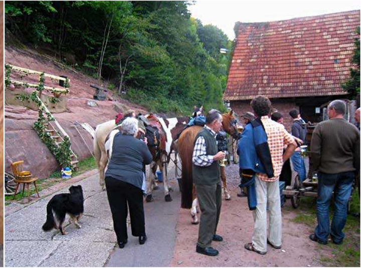
... etwas längerer Pause die letzten Meter bis zu unserem Ausgangspunkt