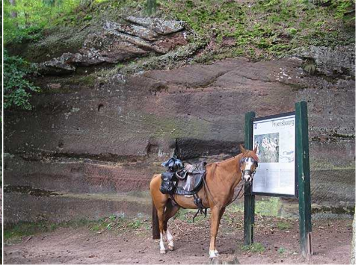
etliche Bäume bilden den Pferdeparkplatz