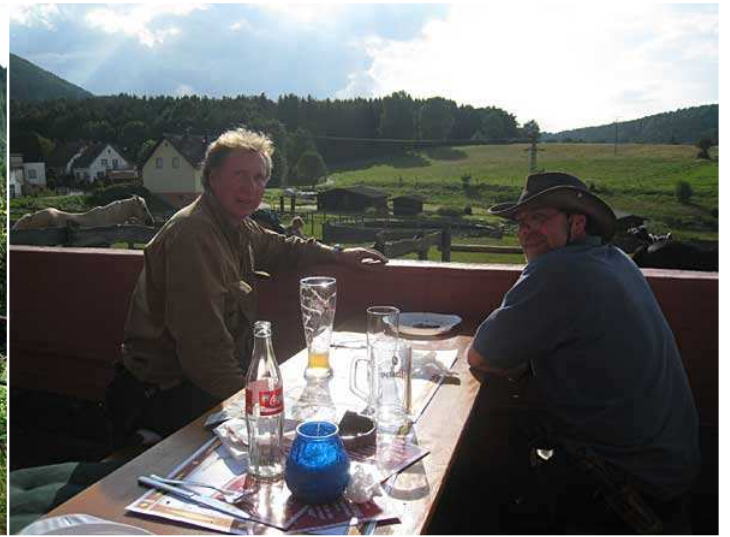
in Gebüg beim Westernfest der Longhorn-Ranch