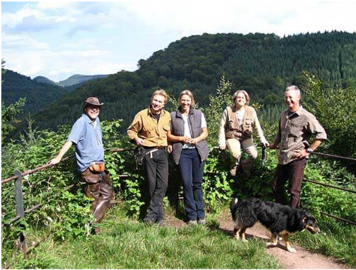
es finden sich immer ein paar Wanderer die gerne Fotos machen