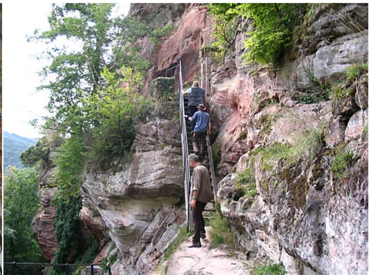
... so kann man ohne schlechtes Gefühl die Felsen ersteigen und die Burg erkunden.