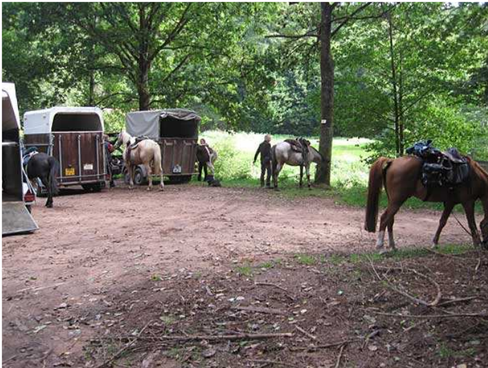
Startpunkt am nördlichen Ende des Fleckensteiner Sees