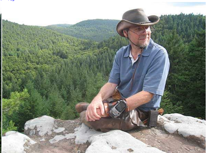
schöne Aussichten über den Pfälzer Wald