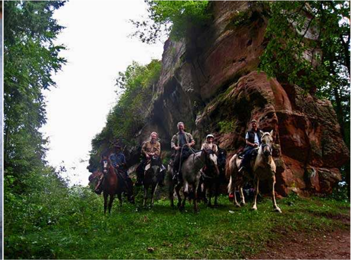
eine halbe Stunde später, wieder in Deutschland, die Ruine Blumenstein