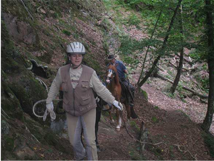
kurz vor der Burgruine