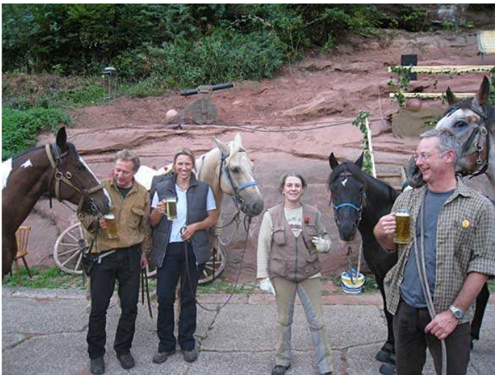
in Hirschthal - Freibier und ...