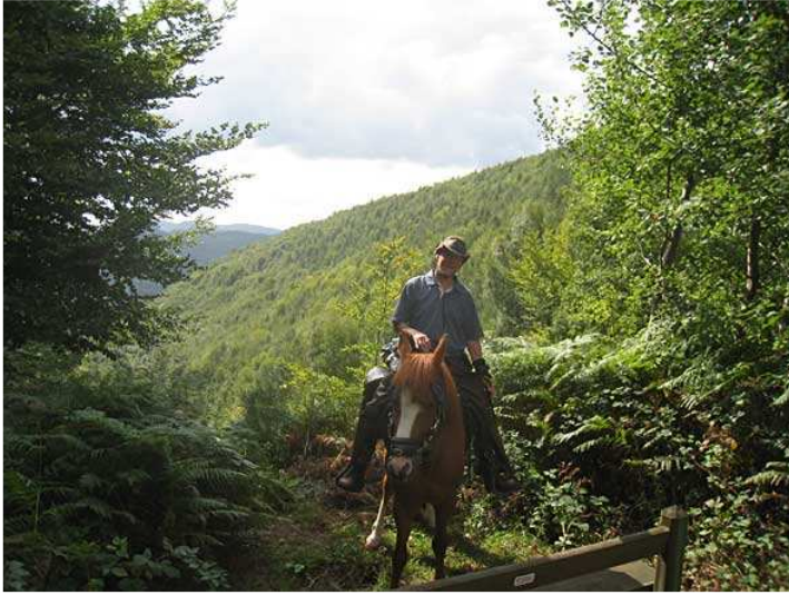
vorbei an Aussichtspunkten ..