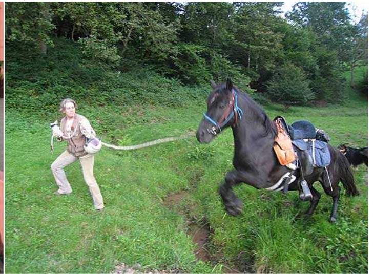
unterwegs müssen sie ihre Geländetauglichkeit unter Beweis stellen