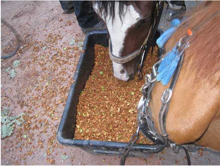
... Frei-Apfeltrester zum Zehnkellerfest reiten wir nach ...