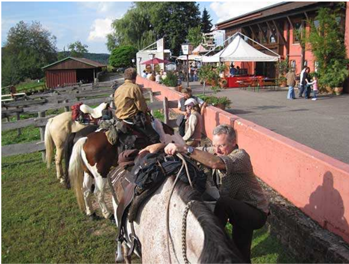
nach kurzer Pause während der die Pferde in Graspaddocks stehen, geht's weiter