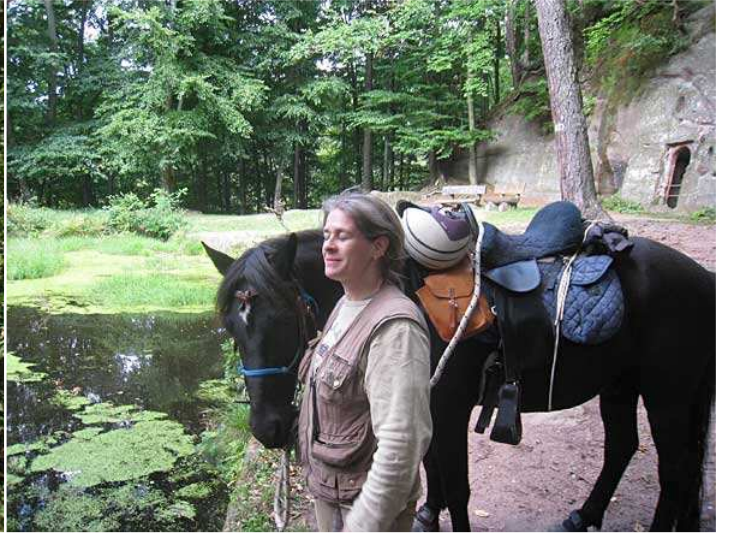
bis zur Ruine Wasigenstein.