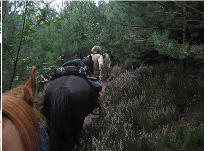
über, teils schmale und steile Pfade ...