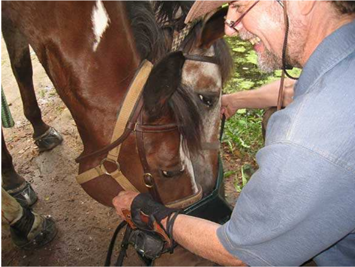
dort gibt's ein schönes Wasserbecken zum Pferde tränken