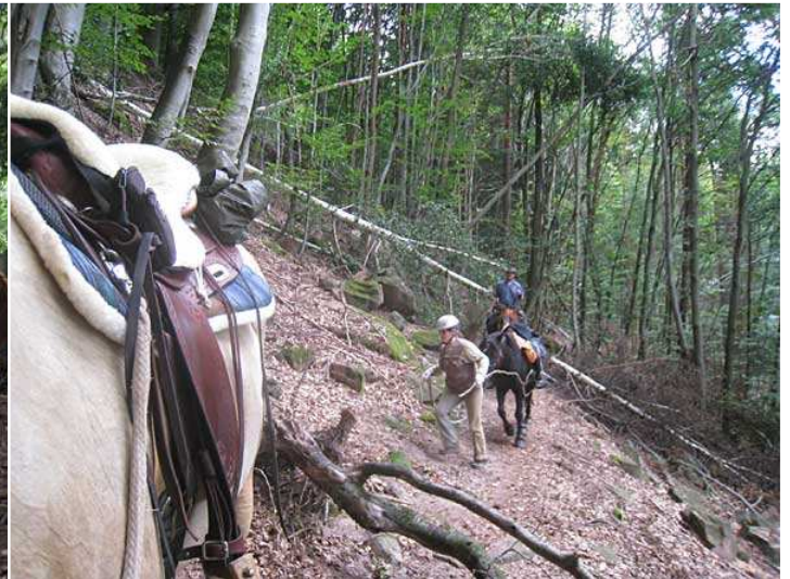
erste Hindernisse auf dem Weg zur Froensburg