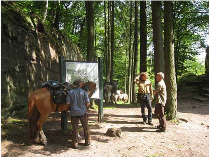
nach einer Stunde Aufenthalt geht's dann weiter ...