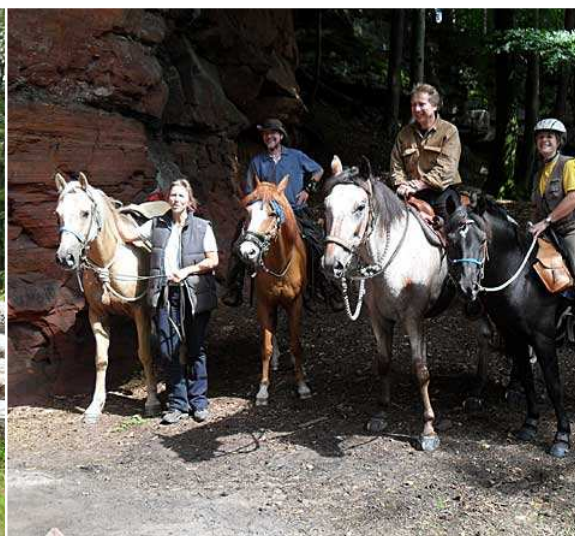
An den hohlen Felsen