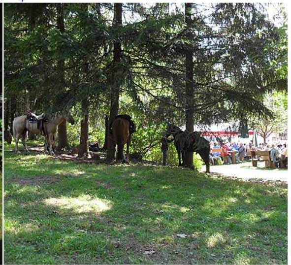
2,4 km und 45 Minuten später haben wir das Wanderheim Hohe List erreicht