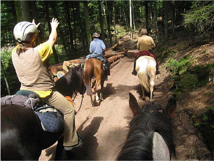
kurzer Abstecher zum Zigeunerfels