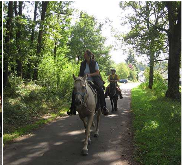
am Ortsausgang von Fischbach