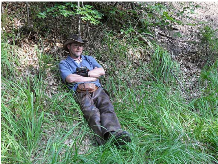
kurze Pause auf dem Weg ins Tal ...