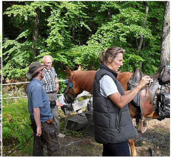
zurück - Top