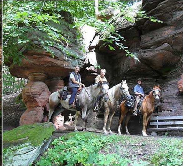
vor und ...