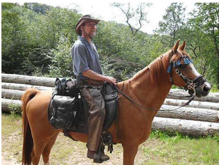
eine Stunde später, auf halbem Weg zu den hohlen Felsen