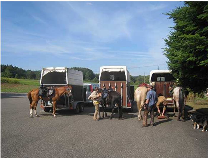
großer Parkplatz am Friedhof von Fischbach