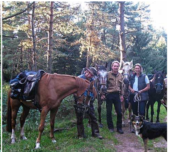
... und Abschlussfoto kurz vor Fischbach