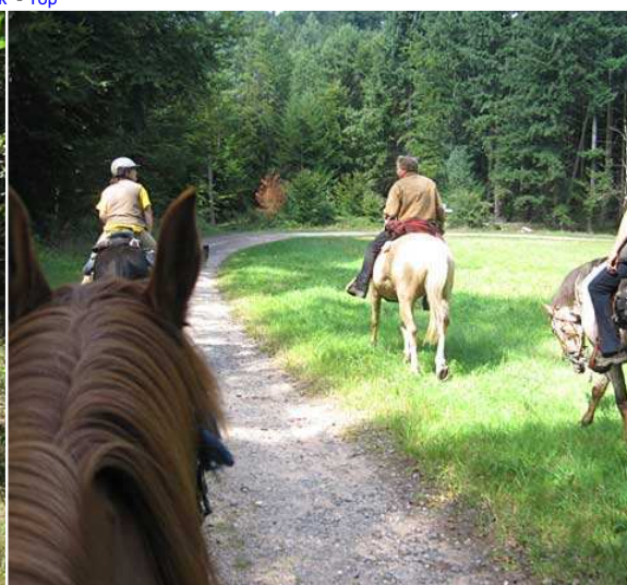
Auf dem Weg zum Zigeunerfels