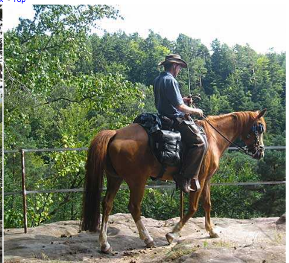
und kurze Pause auf dem Reitersprung