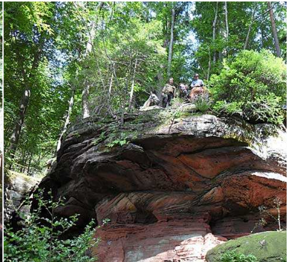
... auf dem Zigeunerfels