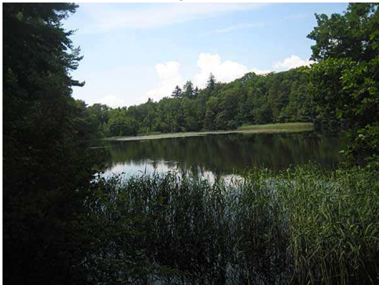
Der Neuwoog (Naturschutzgebiet) mit bewirtschafteter Hütte