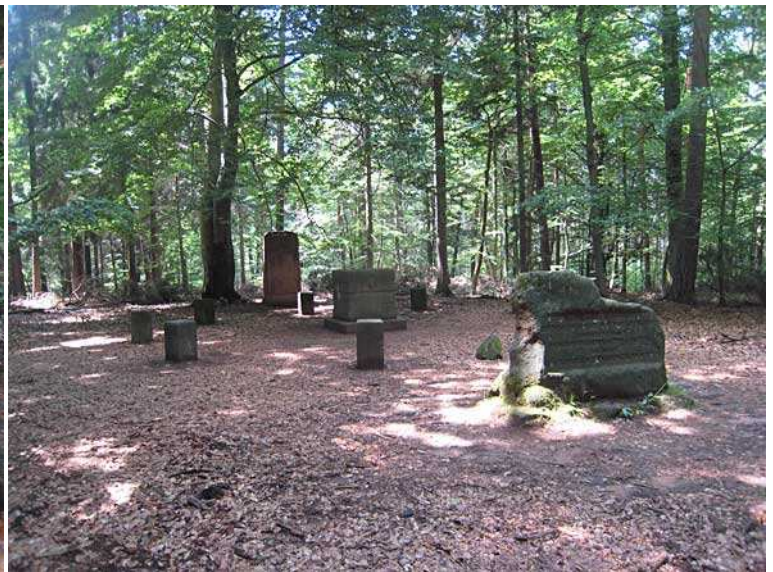
Ein Gerichtsplatz mitten im Wald (aktiv bis ca.1780)