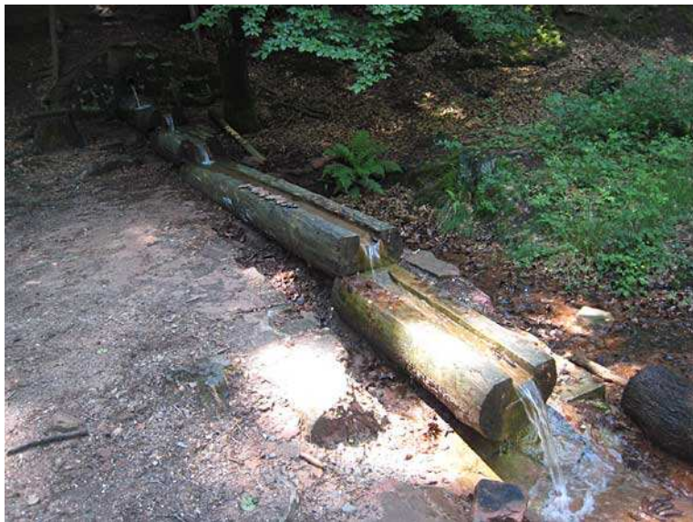
Quelle und Rastplatz am Billesweiher