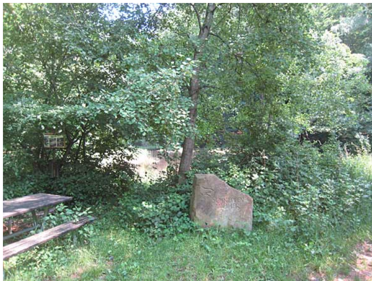
Der Schnepfenweiher ist auf den Karten nicht eingezeichnet

Die Tour ist ein kleinerer Rundritt über Schnepfenweiher, um Neuhemsbach herum, über den Billesweiher zum Neuwoog und zurück. Asphaltanteil 3 mal ca. 8m Strassenüberquerung. Teilweise lange und schöne Galoppwege.