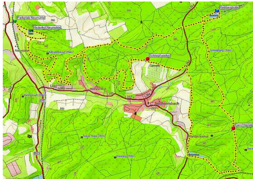
Tour 2 - Ausgangspunkt Münchweiler/Alsenz - Ortsteil Neumühle

Aufzeichnung vom 8.6.2008 - 24km ca. 4 Stunden