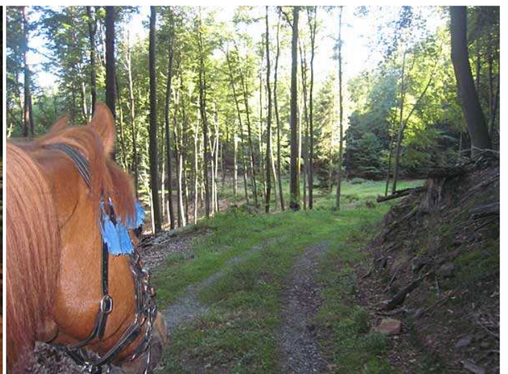
kurz vor dem letzten Anstieg hoch nach Johanniskreuz