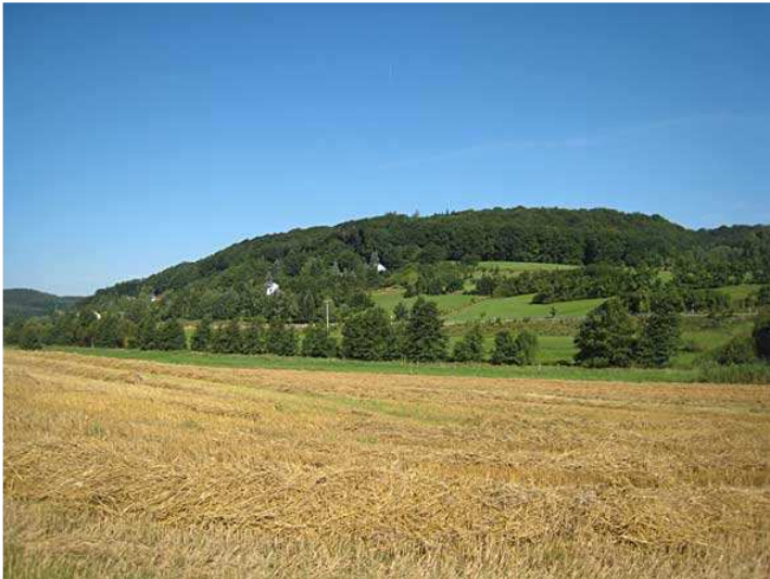
Blick über Heinzenthal nach Norden

Da es für diese Tour sehr viele schöne Bilder gibt habe ich (um die Ladezeiten geringer zu halten) die Seite in mehrere aufgeteilt.