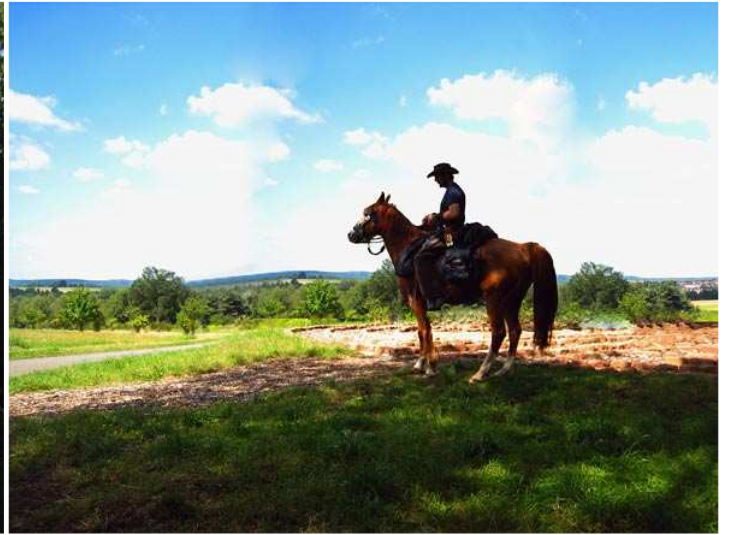
"getürktes Bild", im Hintergrund Enkenbach - ich stehe eigentlich vor einem Wald