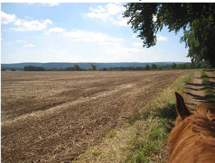
Feld zwischen Altenhof und Harzthalerhof