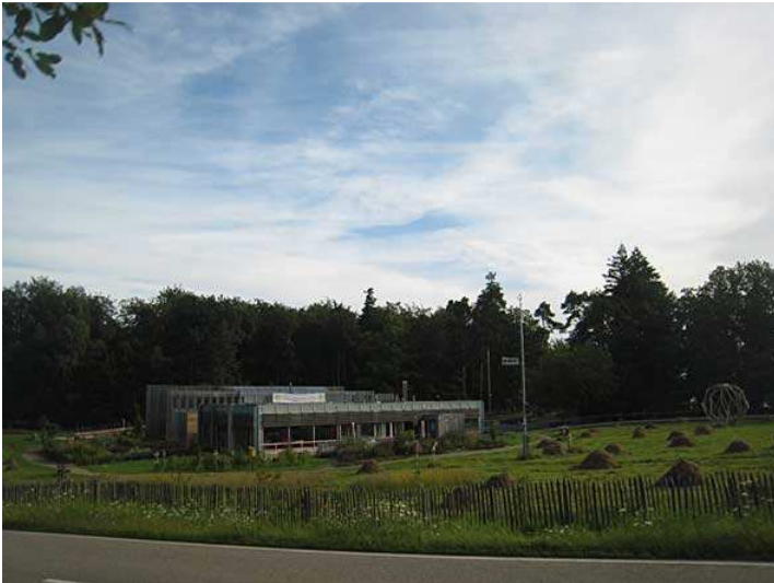
wieder das Haus der Nachhaltigkeit von Süden aus