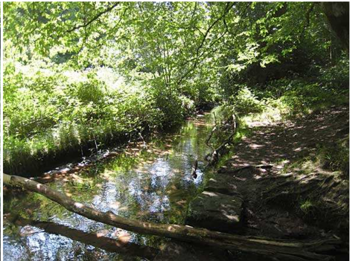
im Leinbachtal - Stelle am Bach an der Pferd trinken kann