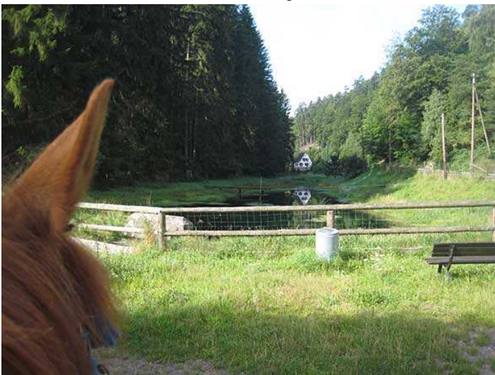
am Weiher an der Speyerbachquelle