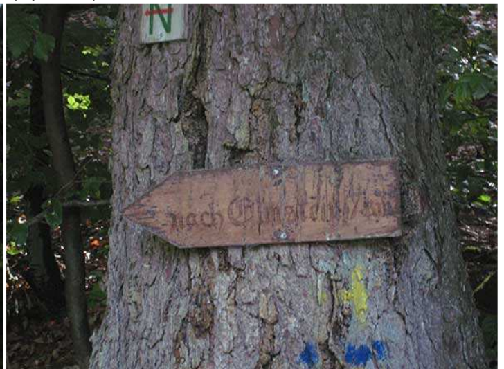
am Weiher an der Speyerbachquelle - Wegweiser Richtung Elmstein 7km