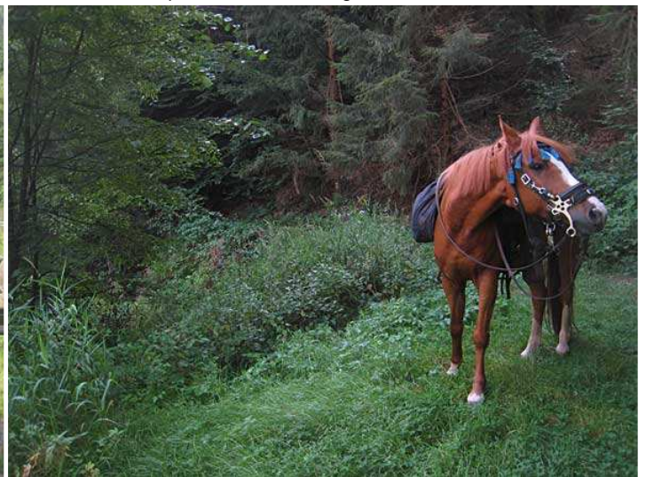
am Weiher an der Speyerbachquelle