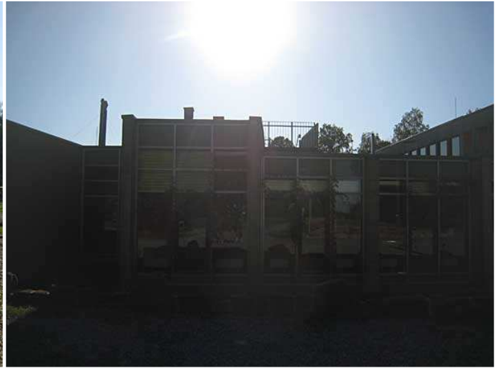
Das Haus der Nachhaltigkeit in Johanniskreuz