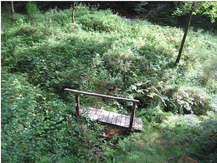
kleine Brücke über kleines Bächlein eine halbe Stunde weiter