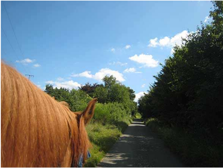
Feldweg hinter Enkenbach/Alsenborn