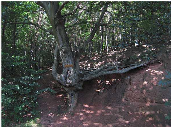
"Wurzelbuche" hinter Neuhemsbach