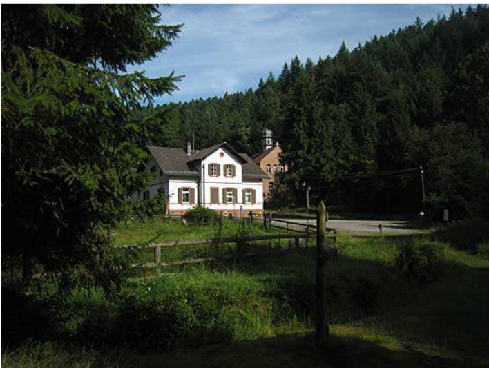
am Weiher an der Speyerbachquelle - Wegweiser Richtung Elmstein 7km