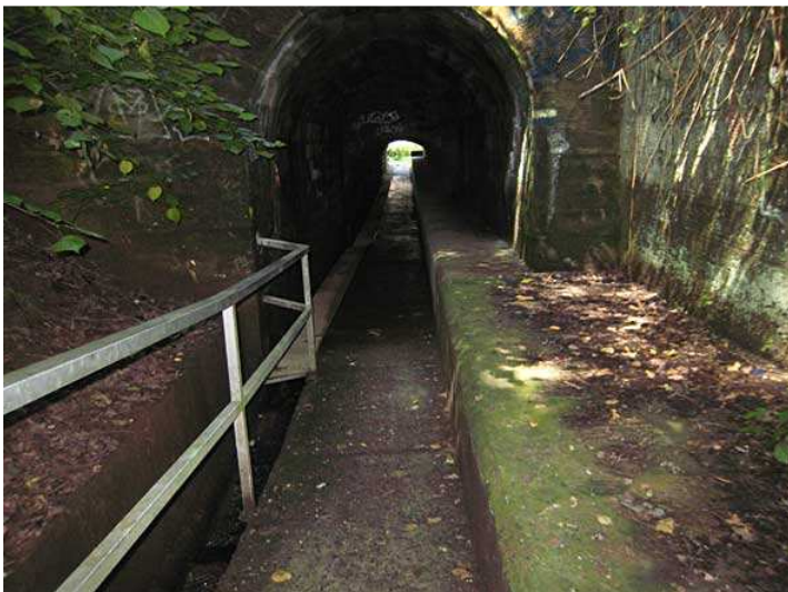
Bahnunterführung in Hochspeyer