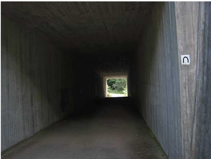
Na ja - was soll man zu diesem Reitweg auch sagen - Autobahnterführung