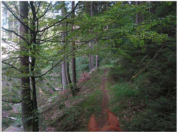
Im Wald kurz nach Mückenwiese