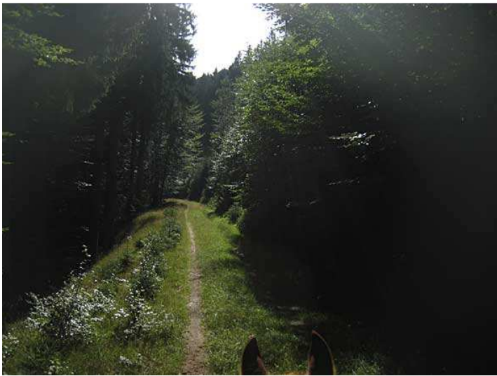
"Jakobsweg" entlang des Speyerbaches