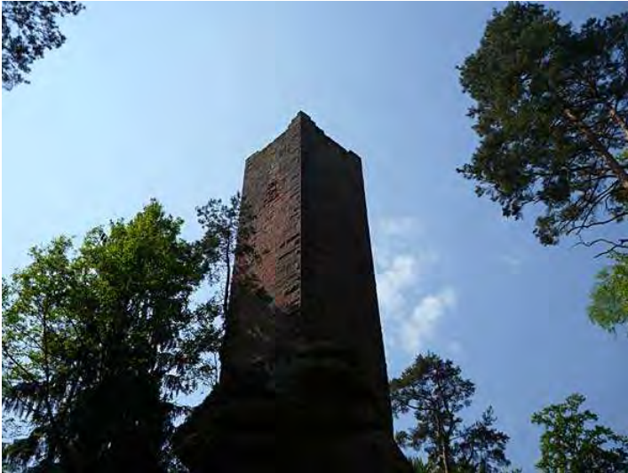
Ruine des chateau de Wineck