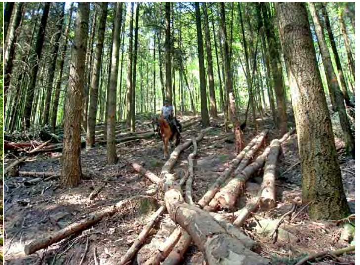
zum Wochenende liegt dann alles rum und versperrt das Weiterkommen