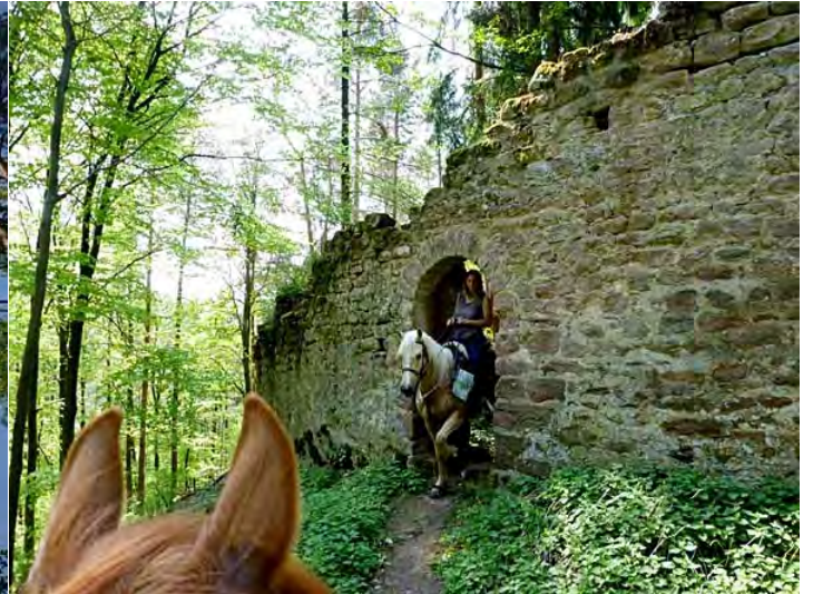
Die Burgmuer von aussen..