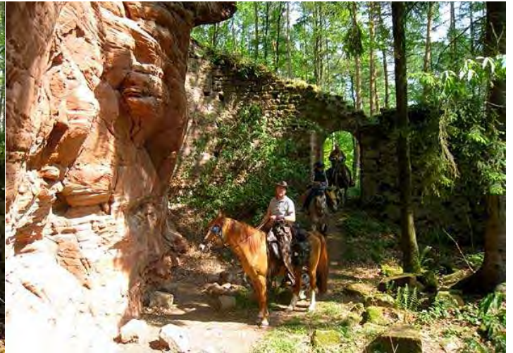
man sieht schon, die Tür scheint ein beliebtes Motiv zu sein!