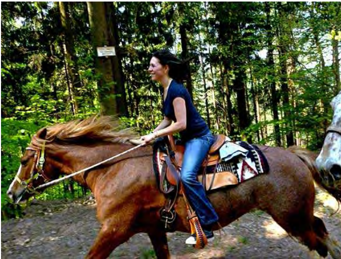
die späteren Galoppaden entschädigen