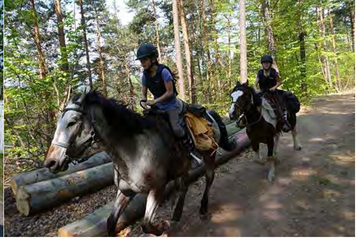
schöne Galloppstrecken vor dem Col du Riesthal