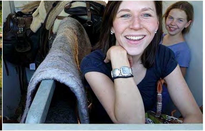
Satteltransport mit Aufpassern