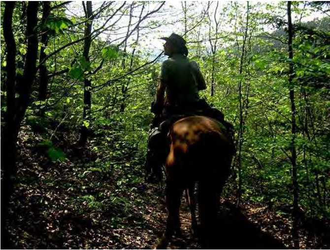
mitten im Dschungel d'Alsace