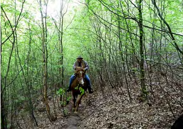
über schmale Pfade geht's bergauf