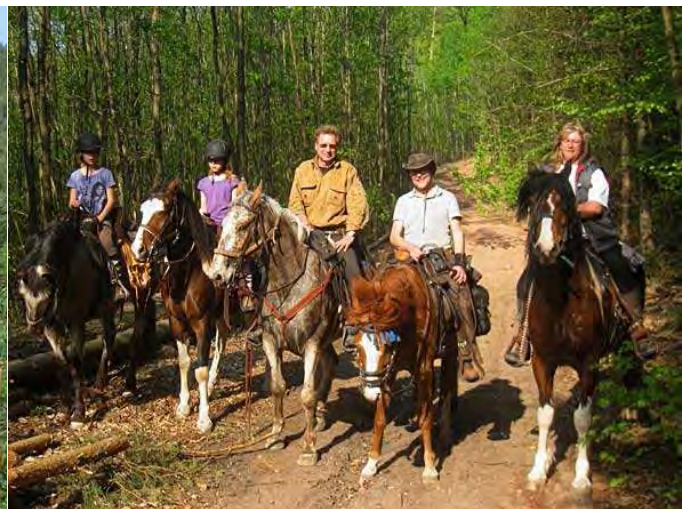
mein Pony hasst diese ständigen Zwangspausen