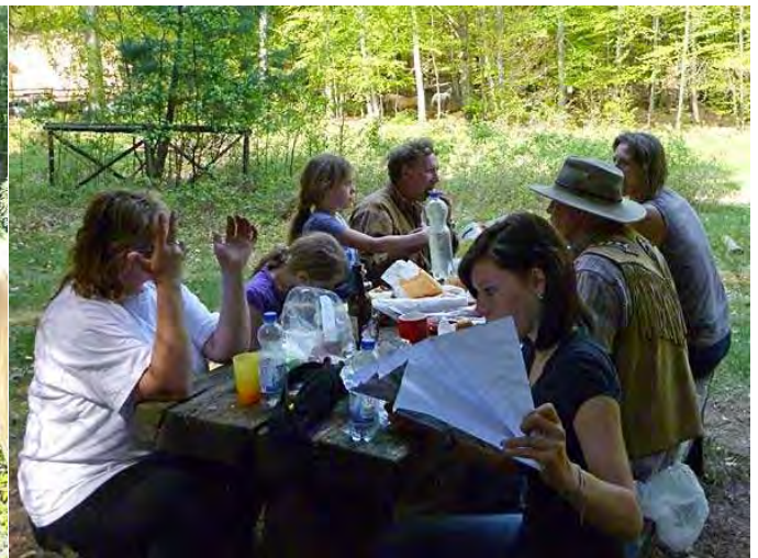
Picknick am Chalet du Wintersberg