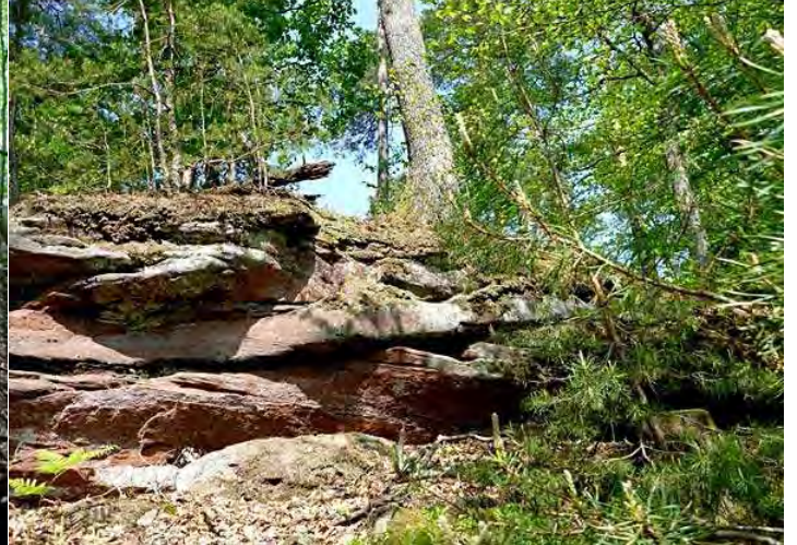
vorbei an den typischen Felsformationen