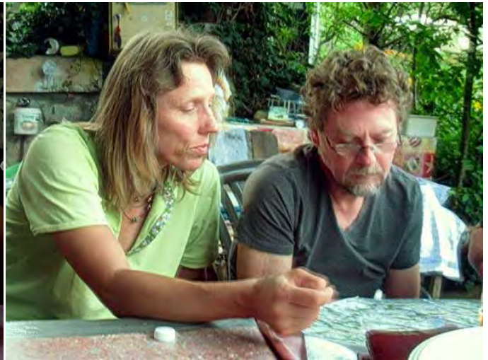
schauen wir mal wo's morgen lang geht