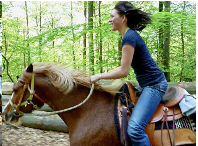
für diese blöde Kletterei, wie man sieht