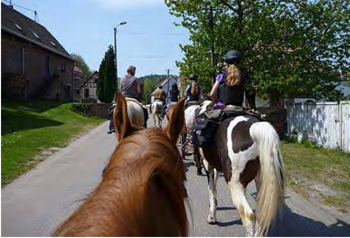
am Ortsausgang von Dambach