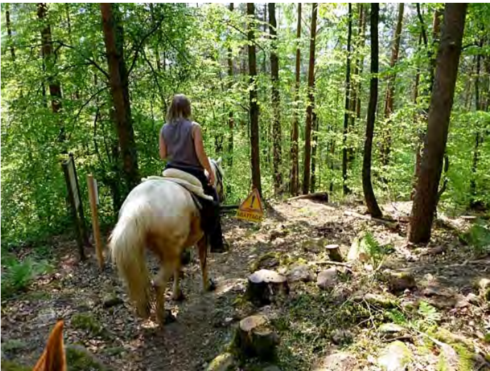
typisch für Waldarbeiten. in der Woche werden Bäume gefällt,