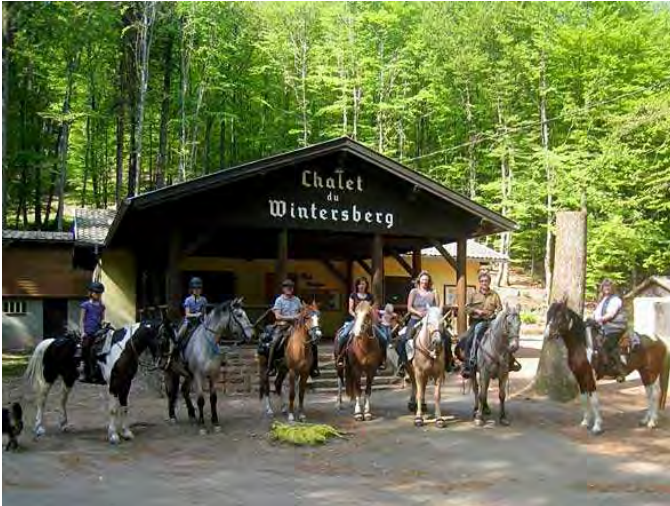
nochmal ein Gemeinschaftsfoto vor dem Weiterreiten