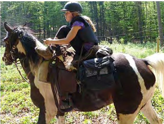
auch wenn dabei die Schnürsenkel aufgehen