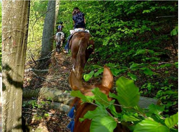
ich glaub' ich bin im Wald ...