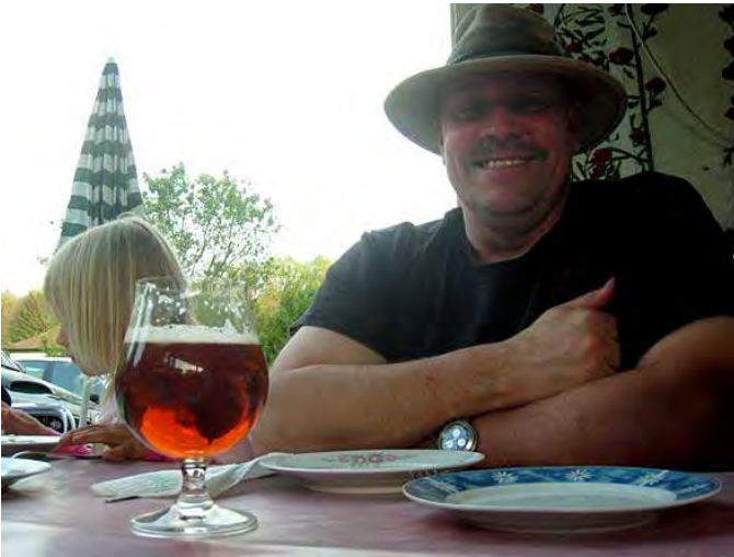
verdientes Bier am Abend