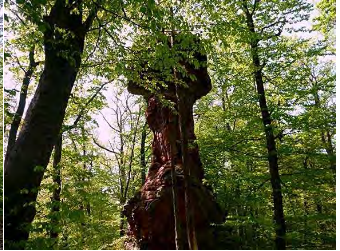
sieht eher wie ne (Doppel-)\"Linse\" aus