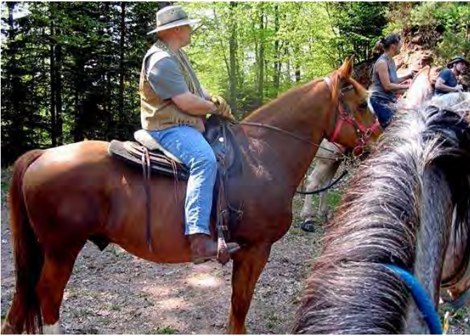
da muss es irgendwas interessantes geben - aber ich weiß nicht mehr was