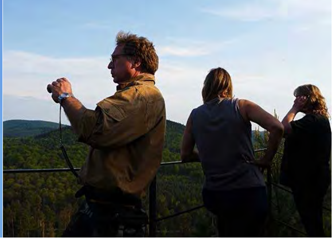
wieder was zum Bklettern