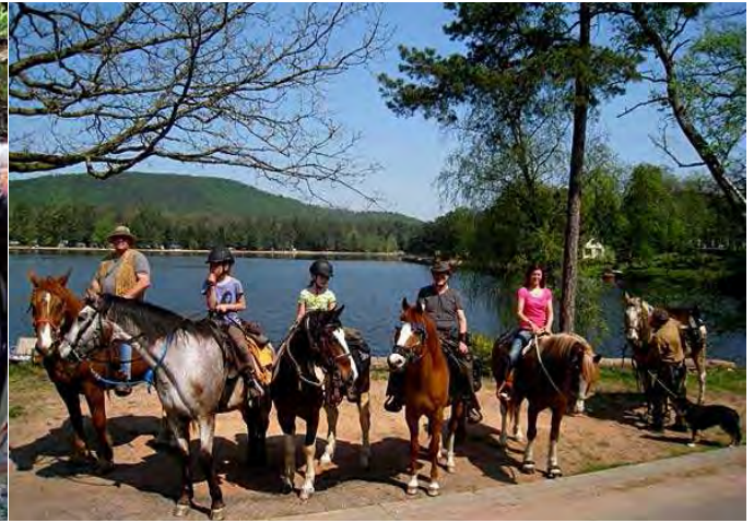
lac de Hanau