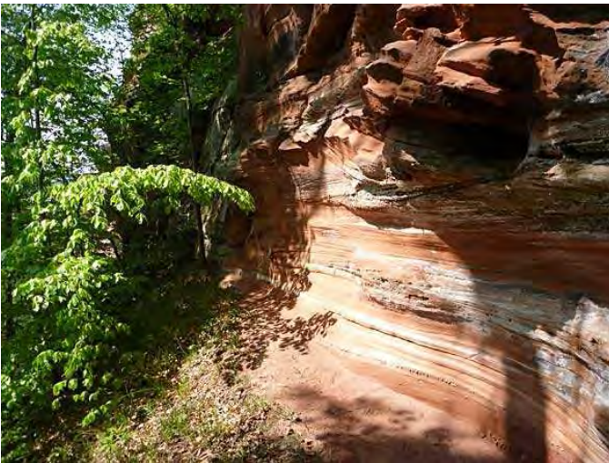
die regional typischen Sandsteinfelsen