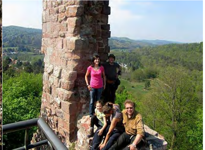
... und hinter Gittern