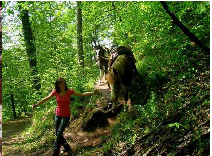
und steilen Abgänge