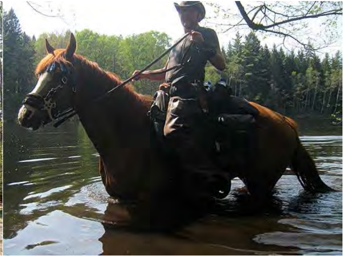
armes Pony versinkt fast im Schlick"