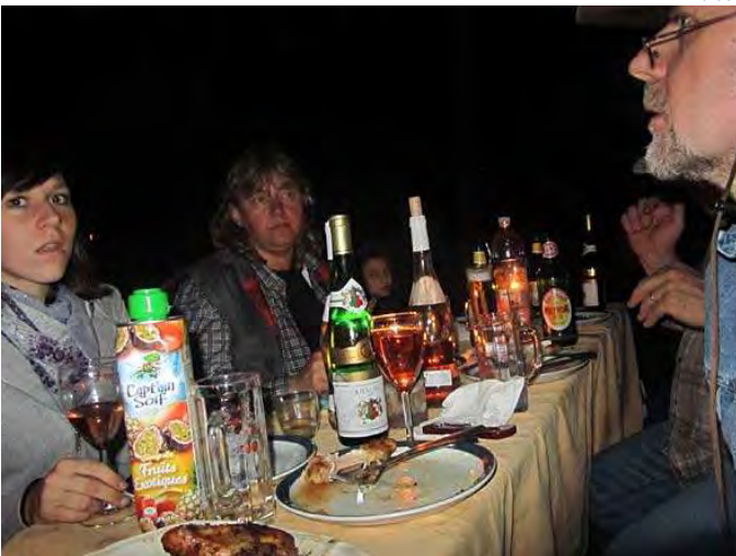
Abendessen in Obersteinbach