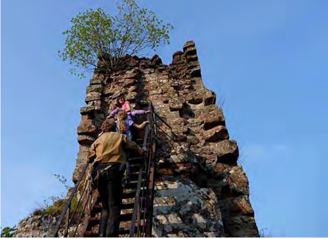
chateau de Lutzelhardt