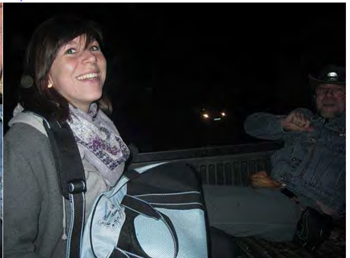
und Hotelbringservice der nicht mehr ganz nüchternen Reiter