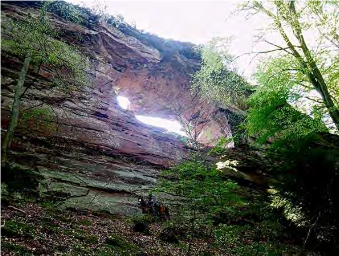
Das grosse Loch - so seht's vom unteren Hauptweg aus ...