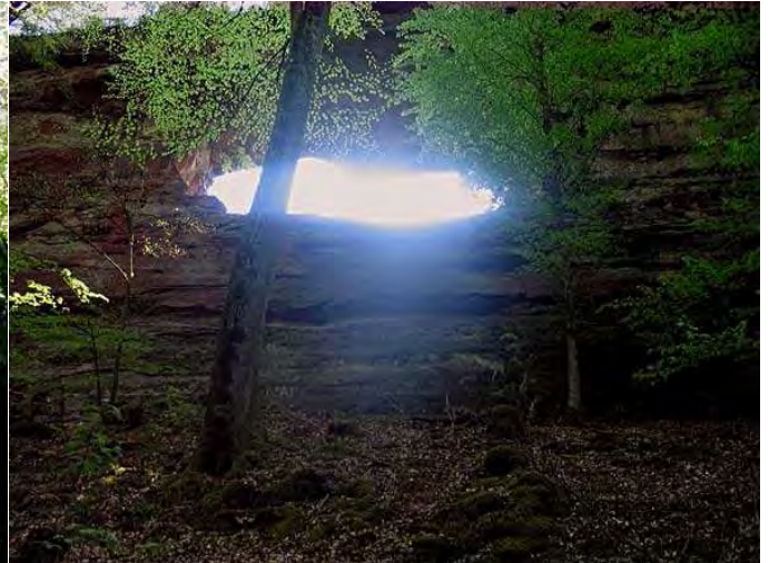
... und so vom oberen Pfad