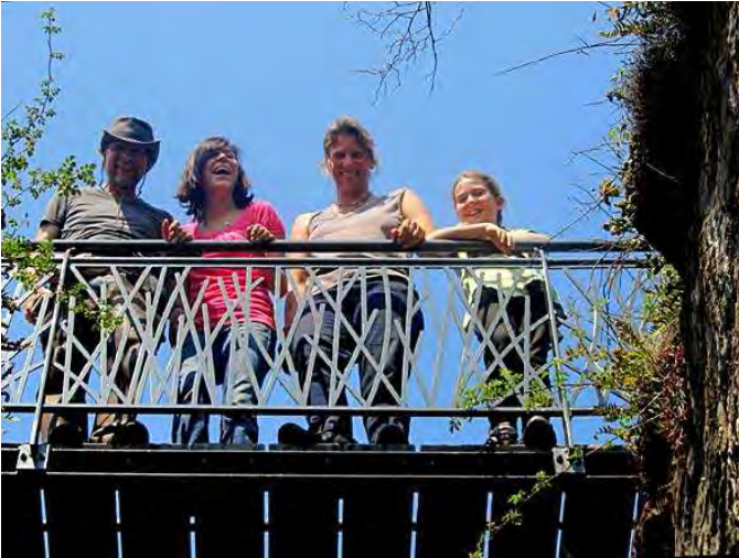
stehen vor ...