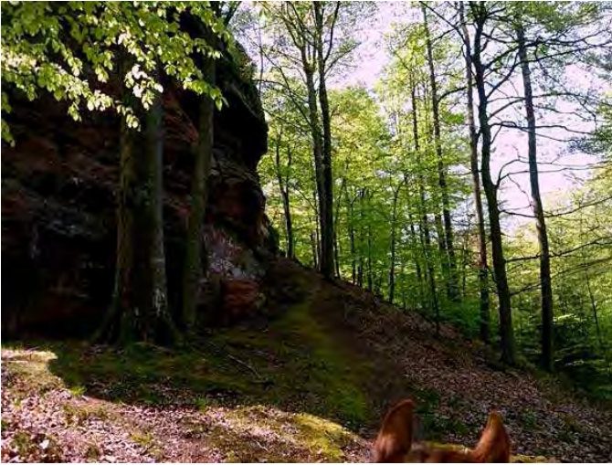
den Pfad an den Erbsenfelsen vorbei bitte nicht nehmen